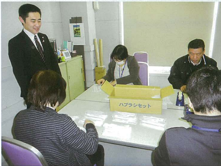
職場実習受け入れを就労支援機関との連携の機会に