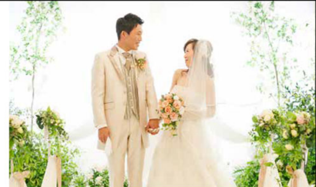
ナチュラルなグリーンと愛らしい色味の花々でコーディネートされたチャペルは、まさに社の中のウエディング。