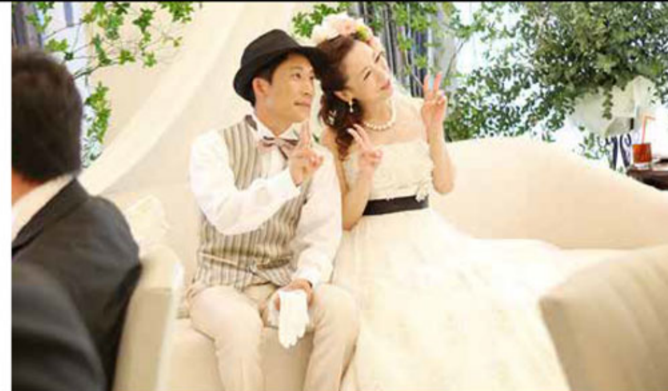
お色直しは、会場のリラックスした雰囲気に合わせてハットや生花を使いながら、おふたりの衣装をアレンジしてドレスダウン。