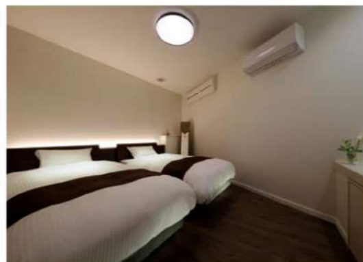
寝室 ご家族でゆっくりお休みいただけるよう、寝室はシンプルで心落ち着くデザインにコーディネートしました。

厳かな中にも、くつろぎの雰囲気を演出した会席場をご用意しました。家族葬スペースと自然につながる同一空間で、故人様の祭壇とともに家族・知人での語らいの時間をゆっくりお過ごしいただけます。