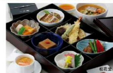
松花堂 4,000円(税別)～ 重箱膳 6,600円(税別)～ 会席料理 6,600円(税別)～