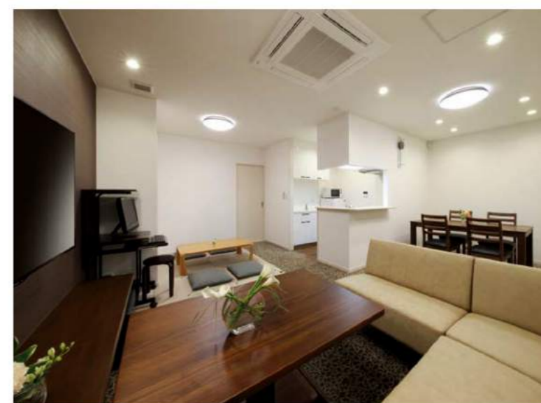
家族室 テーブル席をご用意した、ダイニングスペースには、大型のテレビも完備し、まさに自宅感覚でのくつろぎの時間をお過ごしいただけます。