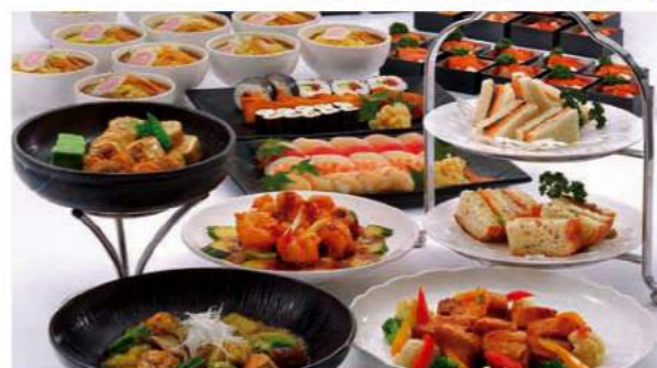
オードブル 10名様分/22,000円(税別)～