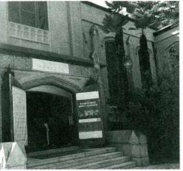
東北学院同窓生にとってはいつ来ても懐かしさを覚える東北学院大学礼拝堂

方に払っていただくには、会員メ リットが必要です。そして簡単に処 理できるシステムが必要です。例え ばQRコードで入会から会費納入ま でをキャッシュレスで行えれば、さ まざまな情報をメールで配信できま す。 またユーチューブを活用して、同 窓会活動などを配信していければ、 それを見ることで同窓 会に行きやすくなりま すし、現役学生との交 流もしやすくなります。 同窓会をもっと開かれ たものとしながら同窓 会会員としての価値が 共有でき、お互いのメ リットを感じていける 仙台同窓会としたいと 思います。それにはや はり原資が必要でその で、工夫をしながら自 助努力をして参ります。 Life, Light t, Loveという東 北学院の3L(サンエル)精神文化、 兄弟愛を大切にしながら、もっと地 域貢献していきたいと考えていま す。4万6千人の会員は、仙台同窓 会にとってはまさに宝です。地方の 経済は、地元の中小企業で成り立つ