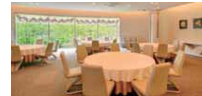
丸テーブルを配した1階は、会食場。2階は家族葬ホール。