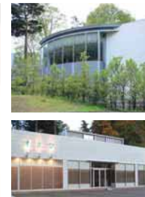
緑に彩られた、落ち着いたモダンなたずまい